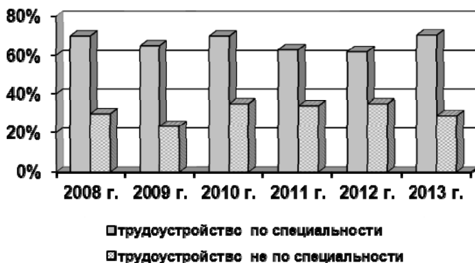
Рис. 3. Соотношение студентов 5-х курсов, трудоустроенных по специальности и не по специальности за 2008 – 2013 гг.

Как следует из результатов анкетирования, спрос выпускников Высшей школы физической культуры и спорта на рынке труда повысился за последние пять лет. Так, в 2013 г. удельный вес трудоустроенных по специальности по сравнению с показателями 2008 г. возрос на 2 %, при этом значительно снизился показатель нетрудоустроенных – на 20 %. Таким образом, темп прироста трудоустроенных выпускников повышается на 4 % в год за счет роста потребности на рынке труда региона в специалистах физической культуры и спорта, а также за счет повышения качества образования выпускников.