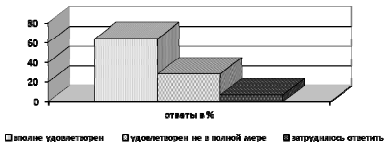
Рис. 4. Удовлетворенность работодателей уровнем профессиональной подготовки выпускников