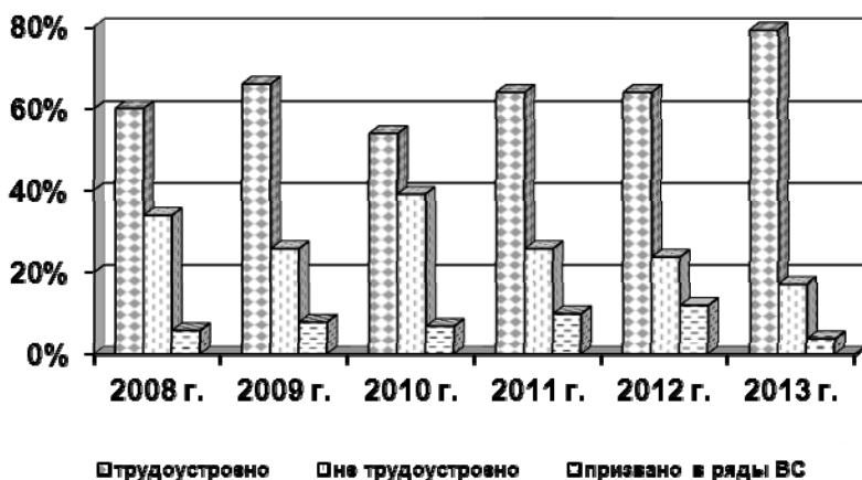
Рис. 2. Соотношение трудоустроенных и нетрудоустроенных студентов 5-х курсов за 2008—2013 гг.

Анкетирование студентов 5-х курсов позволило выявить, что на момент заполнения анкет (май — июнь месяц в год окончания вуза) основное количество выпускников трудоустроено по специальности. Данные об итогах анкетирования представлены на рисунках 2, 3.